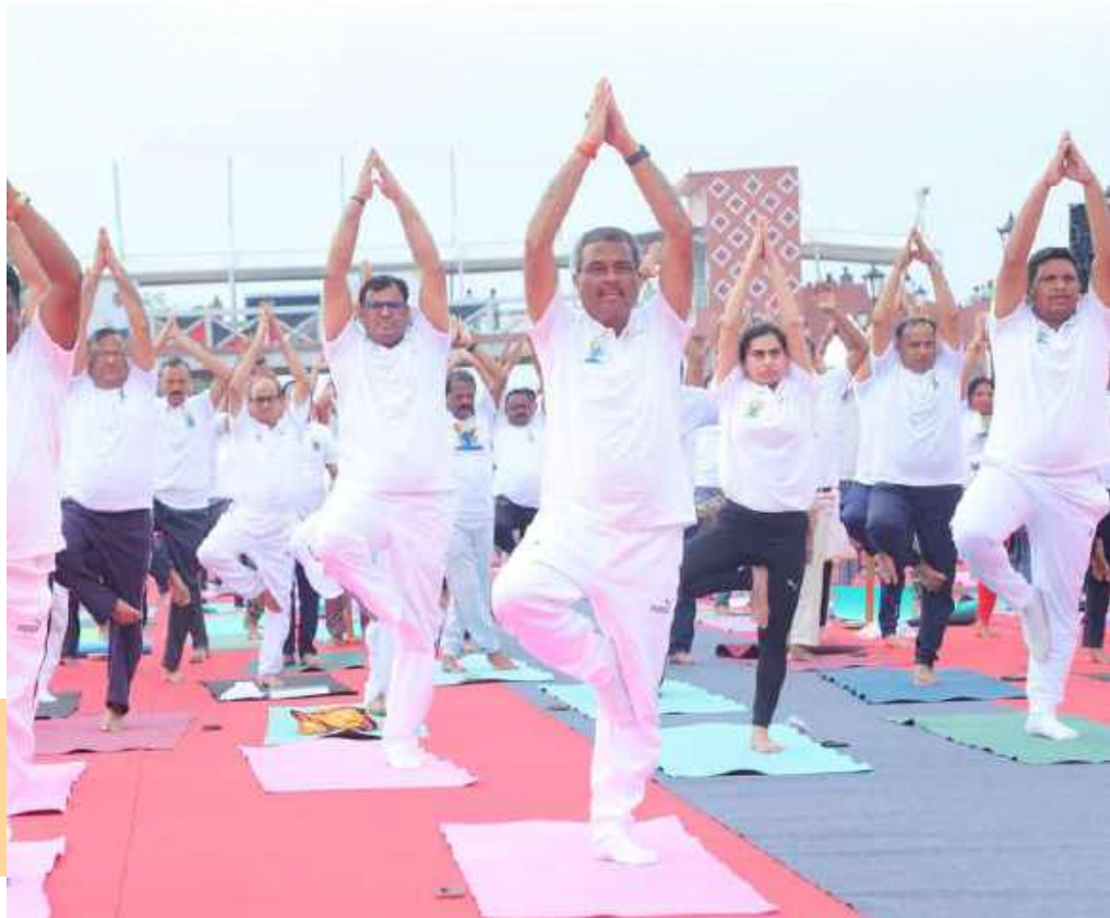
Hon'ble Education Minister Shri Dharmendra Pradhan at Maa Samaleswari Temple Complex, Sambalpur, Odisha

राज्यों/संघ राज्य क्षेत्रों और स्वायत्त निकायों के सभी स्कूलों को अंतर्राष्ट्रीय योग दिवस कार्यक्रम में भाग लेने के लिए प्रोत्साहित किया गया। अंतर्राष्ट्रीय योग दिवस के प्रभावी कार्यान्वयन को सुनिश्चित करने के लिए राज्य स्तर पर नोडल अधिकारी नियुक्त किए गए थे। आयुष मंत्रालय ने 17 मई 2025 को समग्र शिक्षा समीक्षा बैठक के दौरान सभी राज्य सचिवों के समक्ष अंतर्राष्ट्रीय योग दिवस की तैयारी संबंधी एक प्रस्तुति दी। सचिव, स्कूल शिक्षा और साक्षरता विभाग ने भी 16 जून 2025 को राज्य सचिवों के साथ एक बैठक की, जिसमें राज्यों से स्कूलों को योग संगम पोर्टल पर पंजीकरण के लिए निदेश देने का आग्रह किया गया। सभी राज्यों/संघ राज्य क्षेत्रों और स्वायत्त निकायों के सभी नोडल अधिकारियों के साथ एक अनुवर्ती वर्चुअल बैठक 17 जून 2025 को आयोजित की गई, जिसकी अध्यक्षता उप सचिव, शिक्षा विभाग द्वारा की गई।